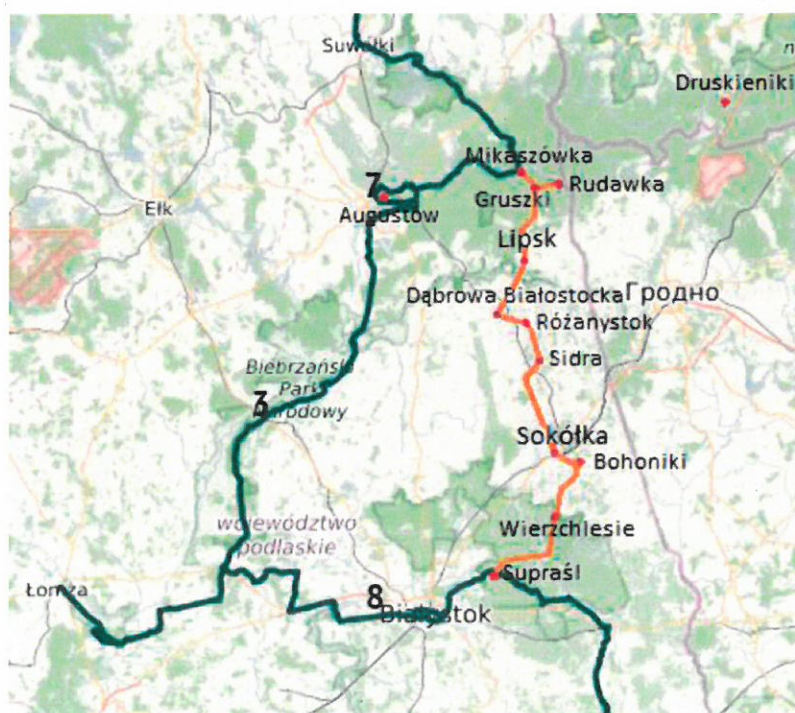
Fot. 2. Propozycja rozbudowy trasy rowerowej Green Velo: Supraśl - Wierzchlesie - Stara Kamionka - Bohoniki - Sokółka - Sidra - Różanystok - Dąbrowa Białostocka - Lipsk - Gruszki - Mikaszówka z łącznikiem do Rudawki