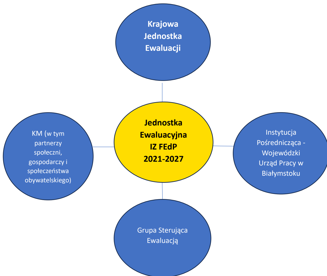
Wykres 2. Podmioty zaangażowane w proces ewaluacji FE dP 2021-2027